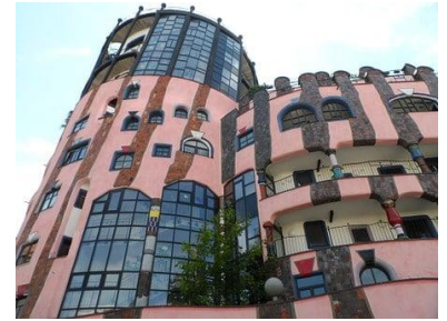
Die Grüne Zitadelle in Magdeburg