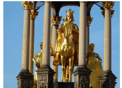
Otto der Große am Altmarkt